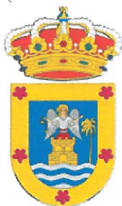
EXCMO. CABILDO INSULAR DE LA PALMA