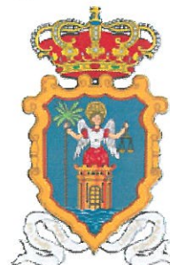
EXCMO. AYUNTAMIENTO DE SANTA CRUZ DE LA PALMA

CONVENIO ADMINISTRATIVO DE COLABORACIÓN ENTRE EL EXCMO. CABILDO INSULAR DE LA PALMA Y EL EXCMO. AYUNTAMIENTO DE SANTA CRUZ DE LA PALMA PARA EL USO DE LAS LISTAS DE RESERVA QUE TENGAN CONSTITUIDAS PARA LA COBERTURA DE LAS NECESIDADES URGENTES DE PERSONAL QUE SE GENEREN EN LOS MISMOS, CON RESPECTO A LAS NECESIDADES Y PRIORIDADES QUE CADA ENTIDAD DETERMINE, ASÍ COMO A LOS PRINCIPIOS DE IGUALDAD, MÉRITO, CAPACIDAD Y PUBLICIDAD.